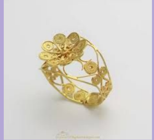
Anello in filigrana d'oro

Manufatti in filigrana vengono tutt'oggi realizzati secondo questa tecnica molto antica, in diverse regioni dell'Italia, in particolare Veneto, Liguria, Abruzzo e Sardegna.