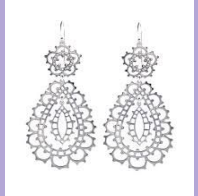
orecchini in filigrana in argento

La lucidatura fa sì che la filigrana appena lavorata venga eliminata dai residui di opacità del metallo in modo da acquisire un colore brillante e luminoso del metallo.