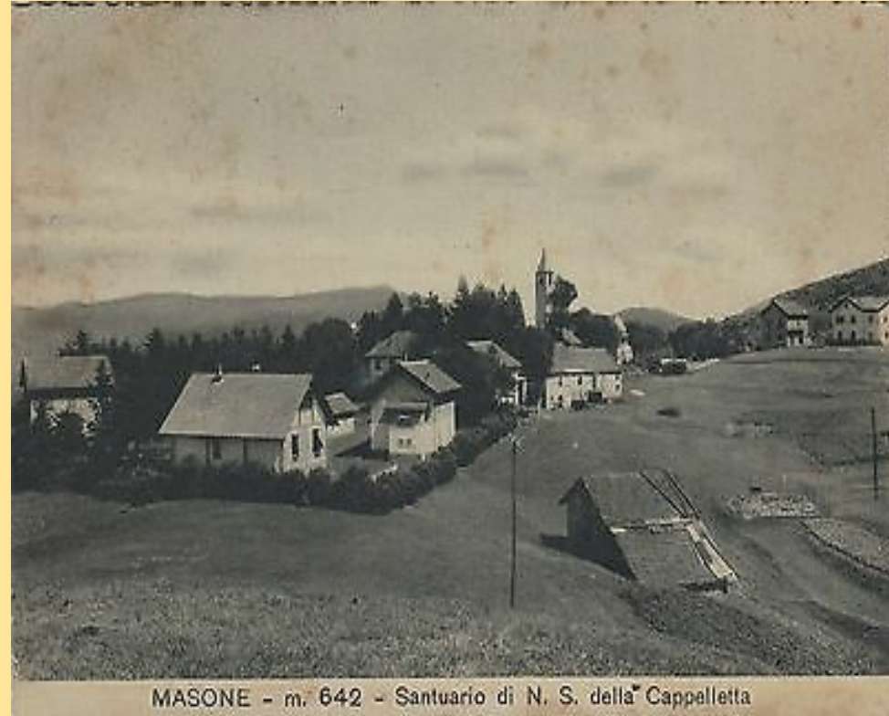
MASONE - m. 642 - Santuario di N. S. della Cappelletta

La tradizione vuole che la Madonna apparisse ad una appestata proveniente da Voltri che trasportava pane infetto, la donna udì le parole di Maria: "Fermati o donna, più non andare, il popolo di Masone lo voglio salvare", ella tornò sui suoi passi e poco oltre morì.